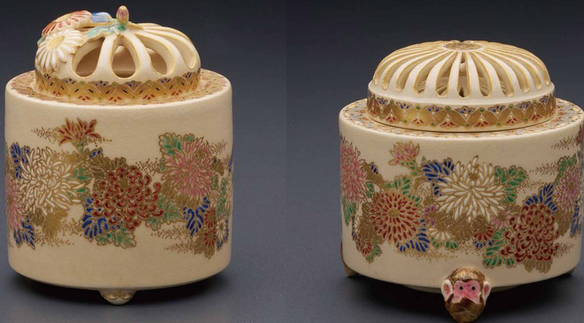
薩摩菊花香爐 直径6.5×高さ8.5cm/A-3 440,000円