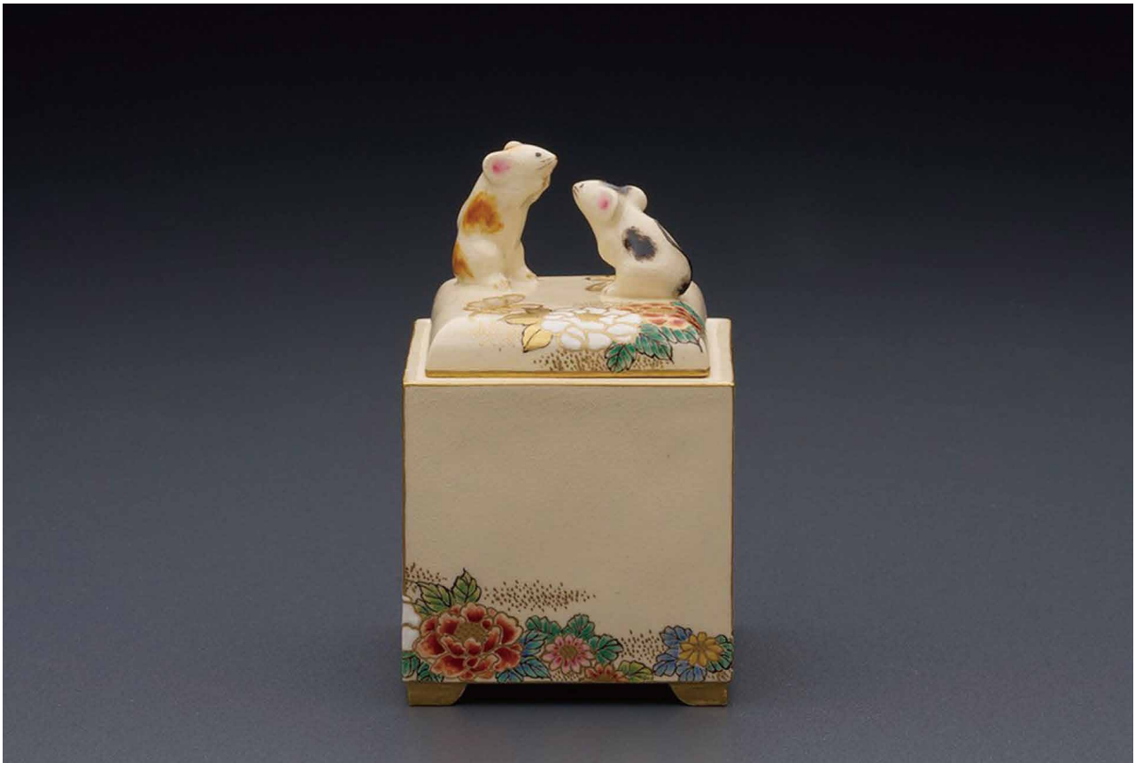
薩摩鼠乗香爐 幅6×高さ9cm/A-6 440,000円