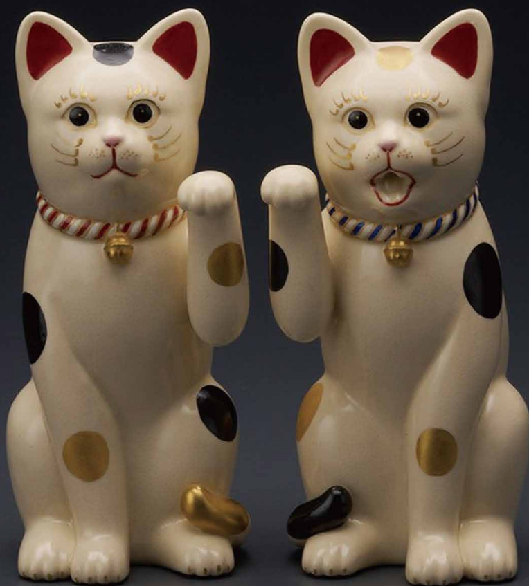
薩摩招猫揃 幅7.5×奥行10.5×高さ19cm/L-1 880,000円