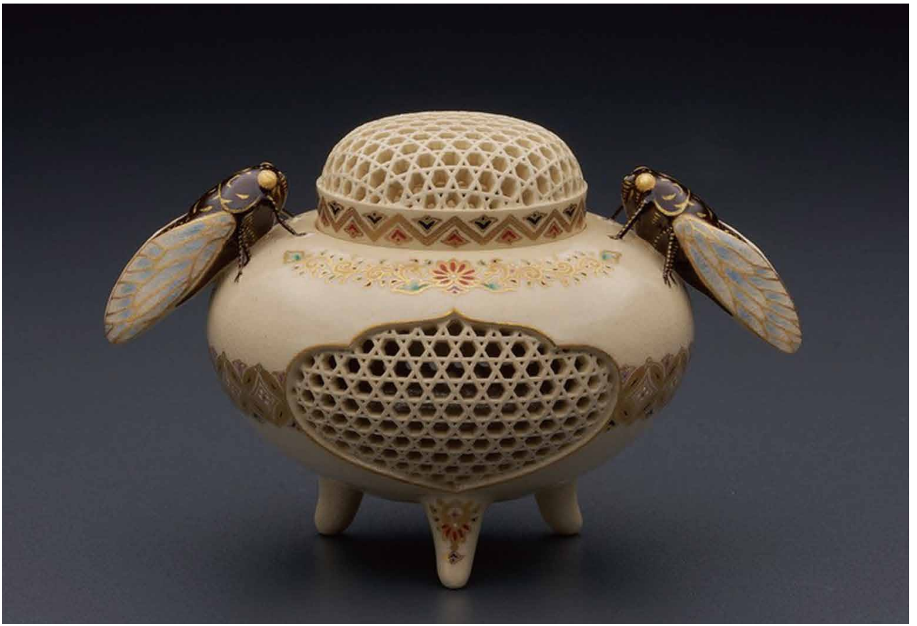
薩摩籠目透蟬香爐 幅12×高さ7.5cm/A-5 990,000円