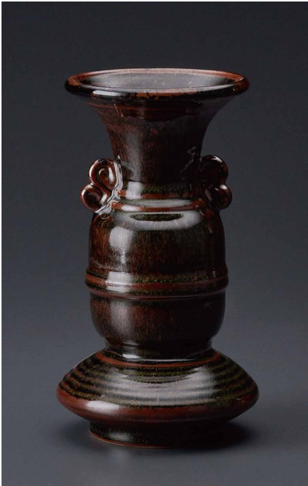
黒薩摩花瓶 直径12×高さ22cm/B-1 198,000円