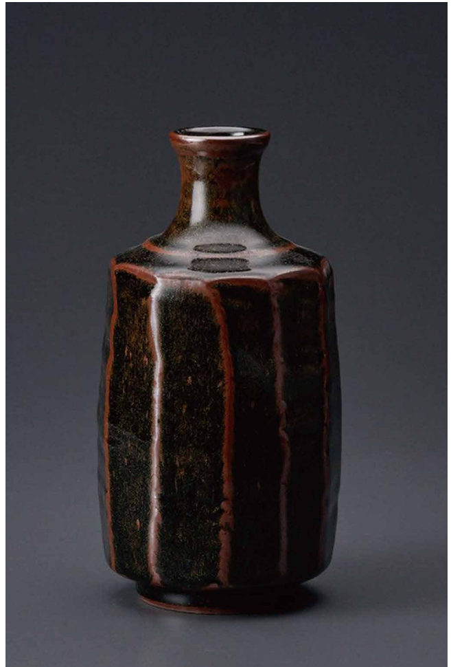
黒薩摩面取り花入 直径11×高さ19.5cm/B-2 121,000円