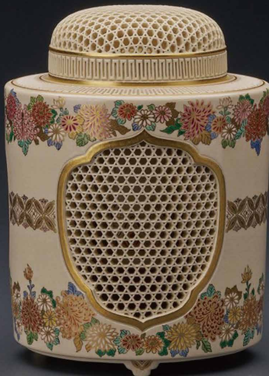
薩摩籠目透筒形菊図香爐 直径12×高さ16cm/A-2 2,200,000円