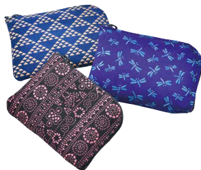
〈印傳工房 南都〉◆奈良県 印傳小銭入 (鹿革、9.5×7×1cm)