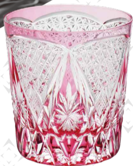
〈矢代硝子加工所〉◆東京都 オールド グラス (径8.3×9cm、クリスタル色被せ) ..... 各35,200円 限定数各3