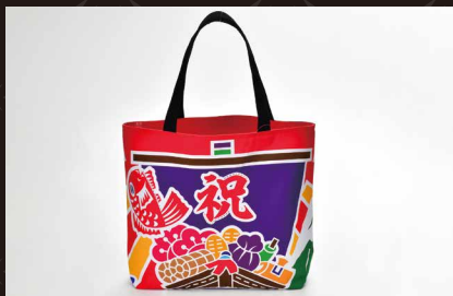
大漁旗 宝船トートバッグ(大)