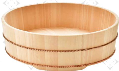
〈桶屋近藤〉◆京都府 榎寿司桶八寸六分 (榎・銅、径25×9cm) ..... 31,900円 限定数3