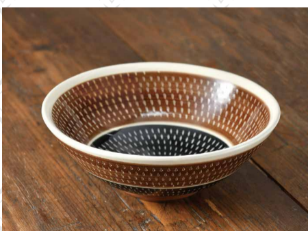
〈柳瀬本窯元〉◆福岡県 呉須盛鉢 (径21×8cm) ..... 9,625円 限定数10

小石原焼の伝統的な技を守りながら、今のライフスタイルに調和する作品づくりを目指しています。昔ながらのベーシックな器をはじめ、呉須を使ったモダンなデザインも多数揃えています。