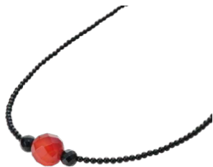
〈voce〉◆千葉県 赤めのうデザインネックレス (めのう・オニキス、長さ約43cm)