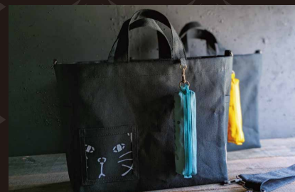
ねこが好きなバッグ