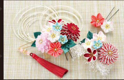
つまみ細工の髪飾り(絹)