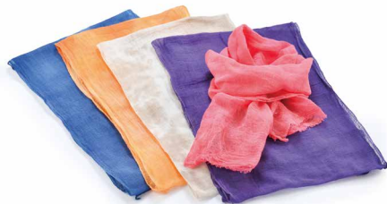
〈ガーゼ服工房「野良着」RIYOKO〉◆宮崎県 お肌にやさしいエコ染マフラー (綿100%〈ガーゼ〉、30×160cm)