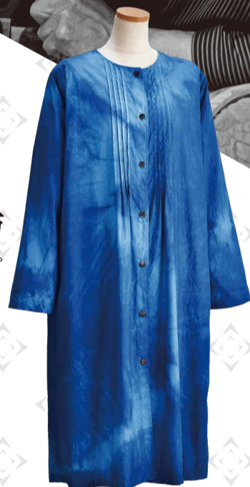
〈染工房石田〉◆石川県 藍染ピンクタックワンピース (綿100%、フリーサイズ) 33,000円 限定数5

金沢市の工房で自家製スクモを使用し、一点一点手染めにこだわって手間暇を惜しまず染め上げ製作しています。藍は色の濃淡で呼び名が変わり薄い方から浅葱、空色、花色、納戸、紺、濃淡などとなります。表情豊かな色合いをお楽しみください。