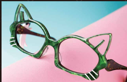
ネコメガネ (アセテート(プラスチック)15×5cm)