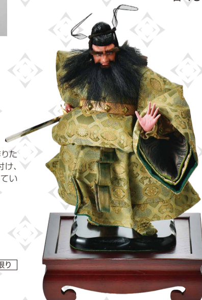
〈人形の島〉◆東京都 鐘旭 (桐粉・胡粉・絹、28×43×23cm) ..... 550,000円 現品限り

「夢と癒しを与えられるような人形を作りたい」という願いのもと、型づくりから絵付け、結髪まで全ての工程を一貫して製作しています。細部にまでこだわった人形です。