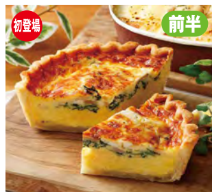
〈バークデリ〉◆札幌 パンチェッタとほうれん草キッシュ

毎回好評の夏の北海道物産展がいよいよ開催。井筒屋開店90周年記念特別商品から初出店ブランドまで北海道の魅力が満載の海の幸やスイーツなどを取揃えております。