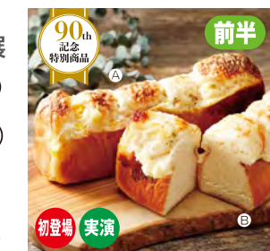
〈ベーカリーカンスケ〉◆岩見沢 ①美瑛コーンフロマーージュブレッド ②クワトロフロマーージュブレッド