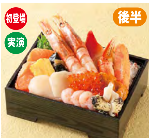
〈北海道工房〉◆札幌 北海道特製弁当