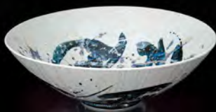
井上 祐希 作 染釉滴 鉢 (径45.0×15.0cm)