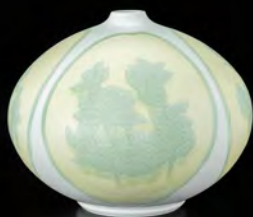
井上 萬二 作 白磁黄緑釉椿彫文 壺 (径36.0×29.5cm)