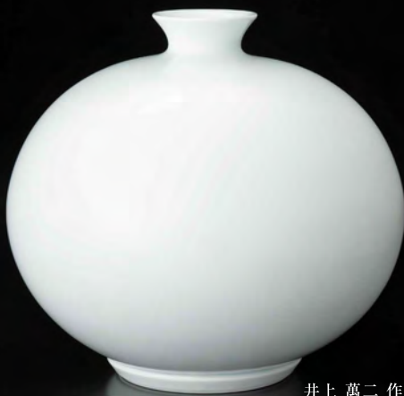
井上 萬二 作 白磁丸形 壺 (径33.5×30.5cm)

昨年、96歳でご逝去されました「白磁」の重要無形文化財保持者(人間国宝)、井上 萬二 先生の追悼展を開催いたします。本展では生前、卓越した轆轤(ろくろ)技術で作られた作品、約50点を展示・販売いたします。この機会にぜひご覧ください。