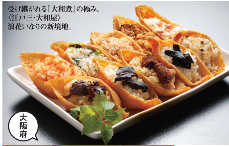
受け継がれる「大和煮」の極み。 (江戸三・大和屋) 浪花いなりの新境地。