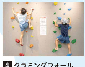
4 クラミングウォール