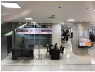
新館7階 結びカウンター