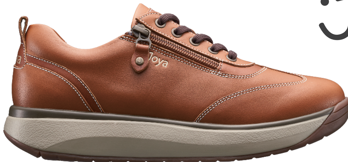
婦人 ローラ ライトブラウン